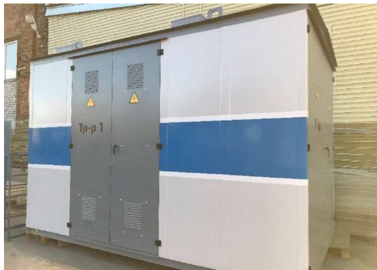
ОАО «Сетевая компания»