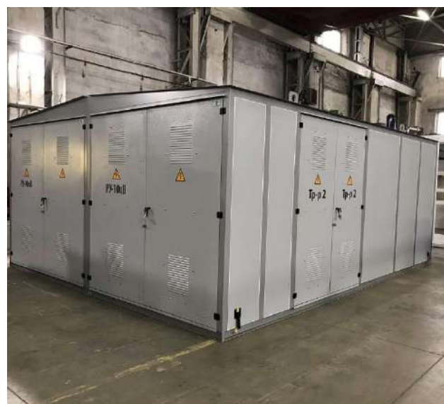
ООО «Энергопром Групп»